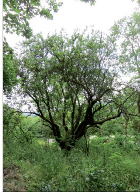
Ansicht: Von Ruhebänk Zollberg-Parkplatz