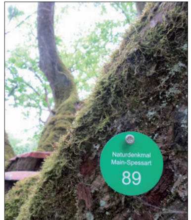
Markierung: Naturdenkmal Main-Spessart 89