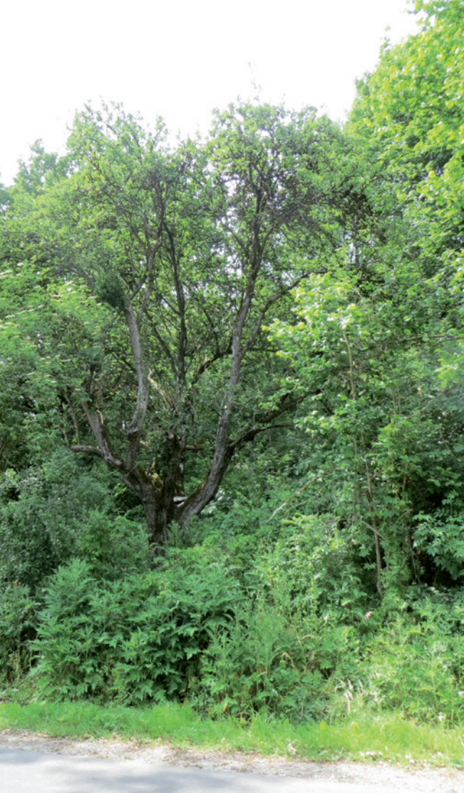
Standort: Zollbergstraße, gegenüber Eingang MSC-Rennbahngelände

Der älteste, katalogisierte, deutsche Apfelbaum steht in Langenprozelten am Zollberg!